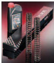
Progresivne vzmeti za vilice