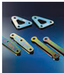
Set za nžanje podvozia