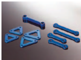
Set za višanje podvozia