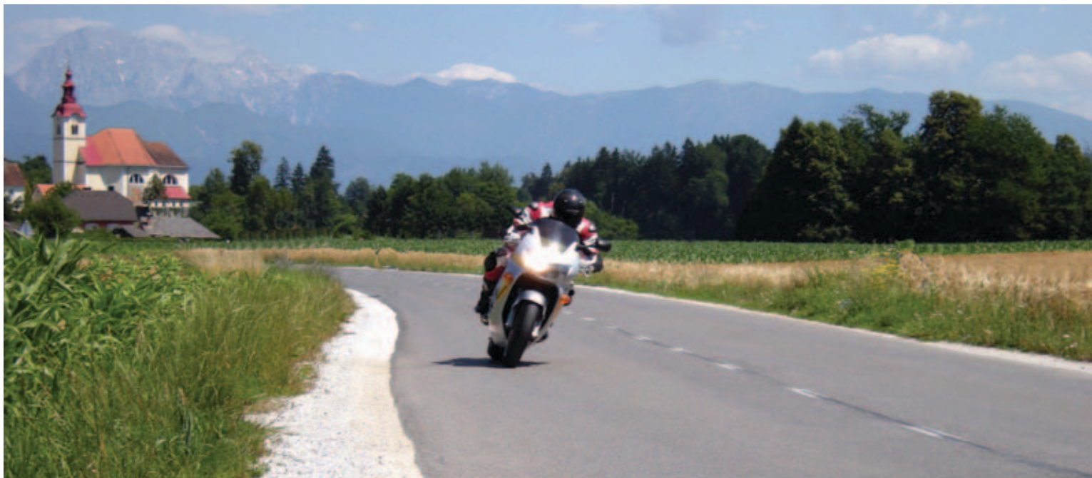
Testna pot: Medvode, Škofja Loka, Gorenja vas, Žiri, Logatec, Vrhnika, Ljubljana, Vodice, Medvode