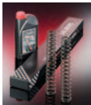
Linearne vzmeti za vilice