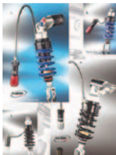
Hidravlična nastavev prednapetosti vzmeti Wilbers