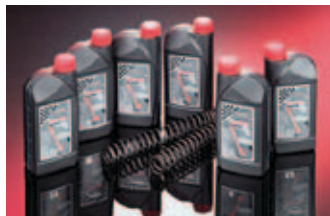
Olja Wilbers za prednje amortizerje