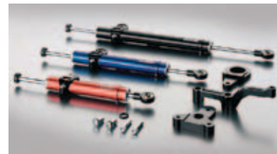
Wilbers amortizerji krmila

Opisi/slike in cene so na: http://www.carman-motosport.si/prodaja/amortizacija_wilbers